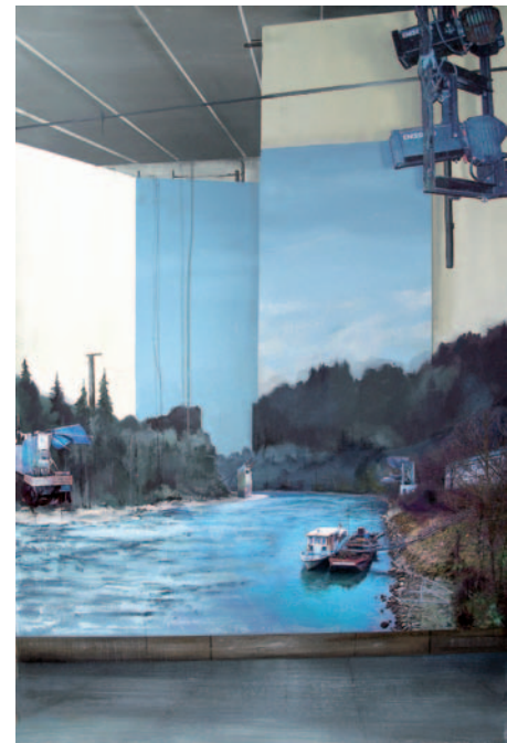
STUDIO 3 2007 Collage auf Leinwand 80 x 120 cm