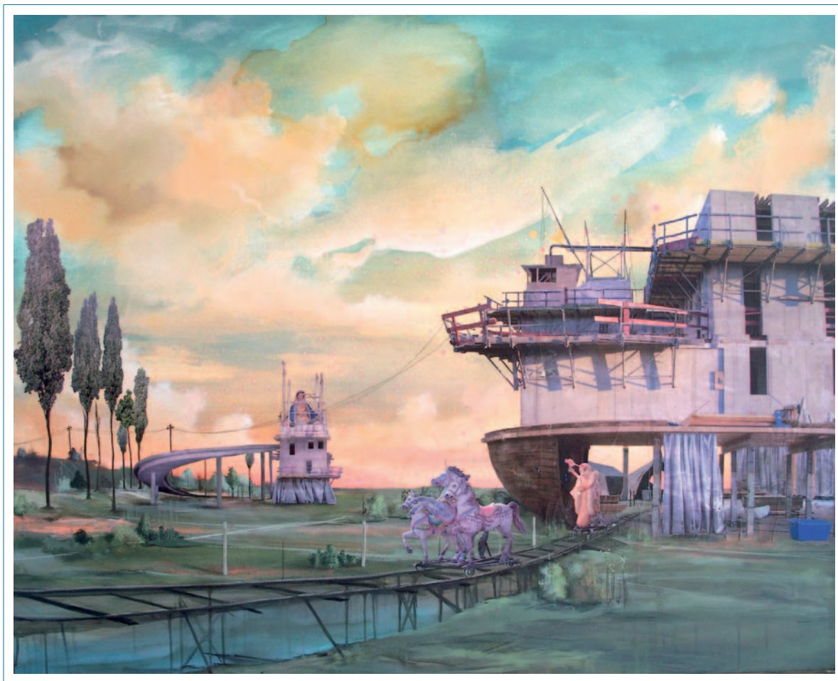
DYNASTIE DISCORDIA 2007 Collage auf Leinwand 155 x 125 cm