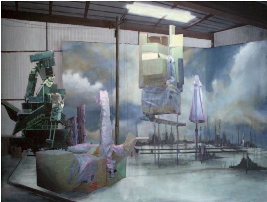
STUDIO 1 2007 Collage auf Leinwand 120 x 90 cm