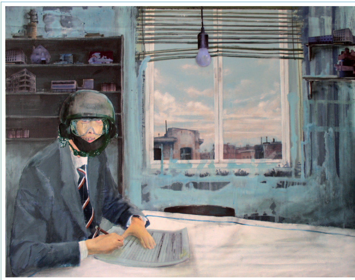
RÄUMER 2006 Collage auf Leinwand 90 x 70 cm